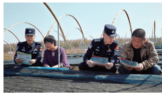
春耕时节农时紧，田间劳作忙生产。当前正值春耕关键时期，抚松大队漫江边境检查站立足边境

此次临江展团在北京农博会上的精彩表现，不仅丰富了长白山特色农产品的展示与优质，也生动体现了临江市商务局主动作为、用心服务企业的务实作风。