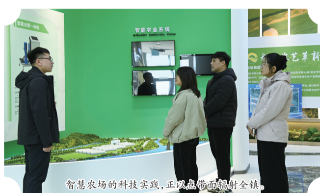
智慧农场的科技实践,正以点带面辐射全镇。

从一座智慧农场的崛起,到全镇农业农村的全面发展,四道沟镇以党建为引领,以产业融合为路径,以联农带农为根本,走出一条乡村振兴的特色之路。