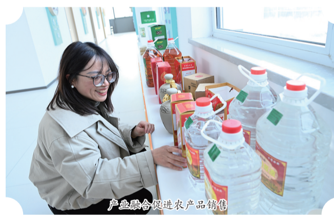
产业融合促进农产品销售