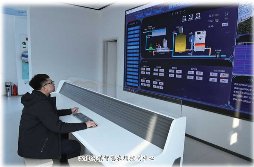
四道沟镇智慧农场控制中心