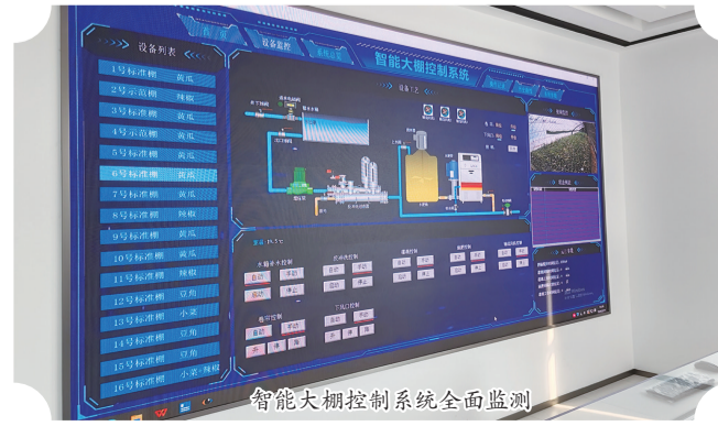
智能大棚控制系统全面监测