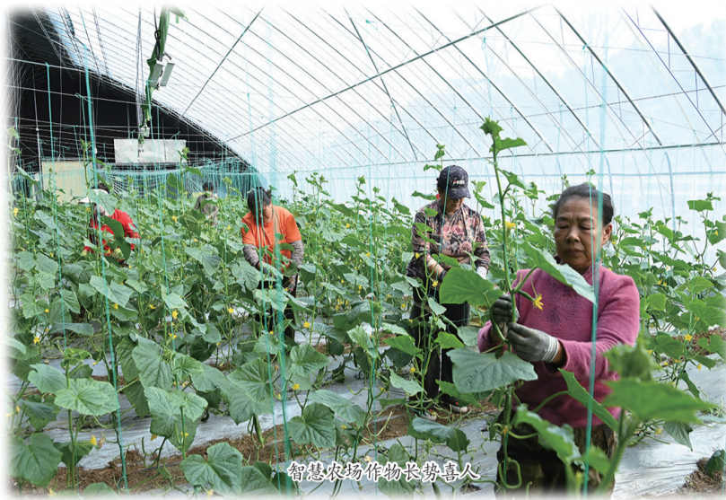
智慧农场作物长势喜人