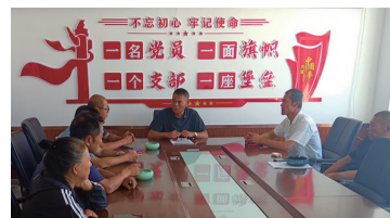
本报于元萍报道 榆树市泗河镇炮手村积极探索乡村治理新路径，创新推行“垃圾不出院”分类处理模式。

方案，将抽象的理论知识转化为实操技巧，切实破解养殖户在生产中遇到的“急难愁盼”，让科技服务真正沉到一线、落到实处。 一场培训，连接起专家与农户；一项技术，激活了产业新潜能。此次“科技助农”活动，是龙井市立足地方产业需求、推动科技资源下沉的生动实践，不仅有效提升了养殖户的科技素养与实操能力，更搭建起“专家赋能+农户受益”的良性互动桥梁。