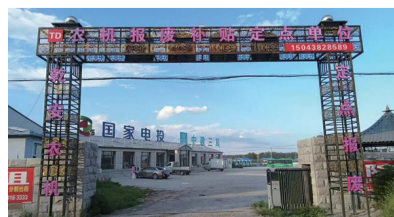
乾安县天得农机定点报废拆解有限公司

载机、自卸吊、拆解机、压块机等十余台套专业设备，构建起集上门回收、协助报备、合规拆解、残值兑现于一体的“一站式”服务体系。业务已覆盖全县十个乡镇，为拖拉机、收割机等各类农机提供便捷处置服务。通过科学拆解与分类，报废农机转化为可再利用资源，实现变废为宝，大幅减少环境污染。公司在推动绿色发展的同时，还提供30余个就业岗位。公司始终秉持环保初心与服务意识，通过专业运营促进农机装备更新，提升农业效率，走出一条环境友好、资源节约的辅助产业之路。 公司计划在省内设立多家分公司，进一步拓展服务网络。同时，将继续坚守诚信底线，严把回收关口，提升专业水平，为全省农业高质量发展持续注入绿色动能。