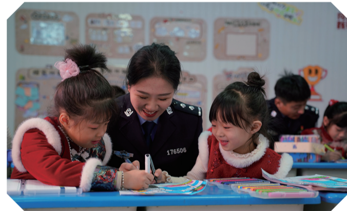
在第六个中国人民警察节来临之际,吉林白山边境管理支队兴隆边境派出所民警走进临江市华艺幼儿园开展普法活动。

种子,都会在这里进行第一轮严格“选拔”。公司技术人员全程跟踪记录它们的生长表现、抗性、产量及适应性,基于试验田里得到的第一手数据,量身定制,真正做到为农户推荐最合适的选择,这种科学的筛选方式,极大帮助农户降低了选择风险,实现增产增收。