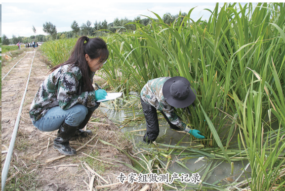
专家组做测产记录