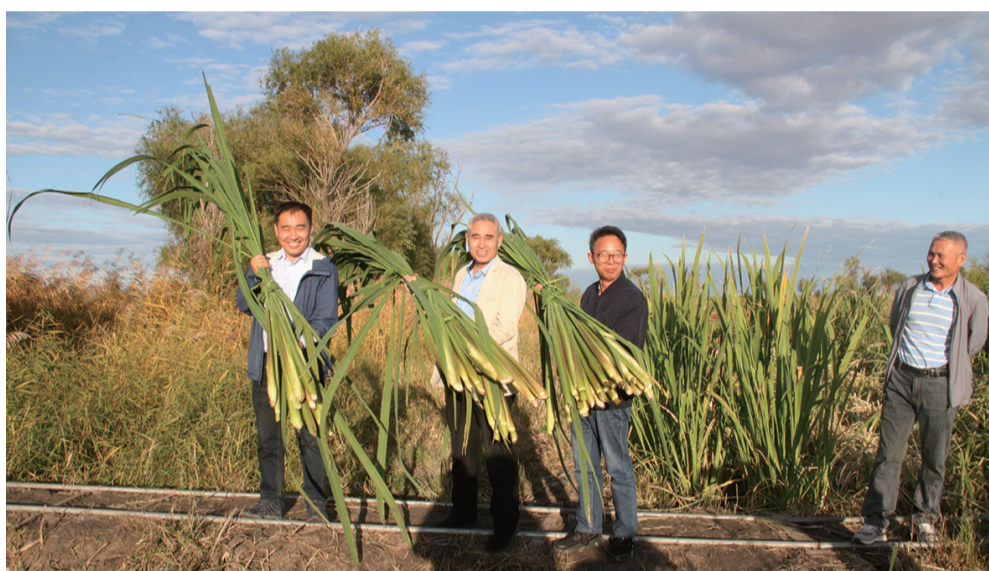
专家组在镇赉茭白种植基地进行茭白鲜草测产

当镰刀划过茭白秸秆，清脆的“咔嚓”声在田间响起，割下的茭白被整齐码进竹筐，抬到田边的电子秤上。“1.2公斤”“1.35公斤”……读数声此起彼伏，数据被一笔一划记在表格里，汇总时，田埂边围拢的