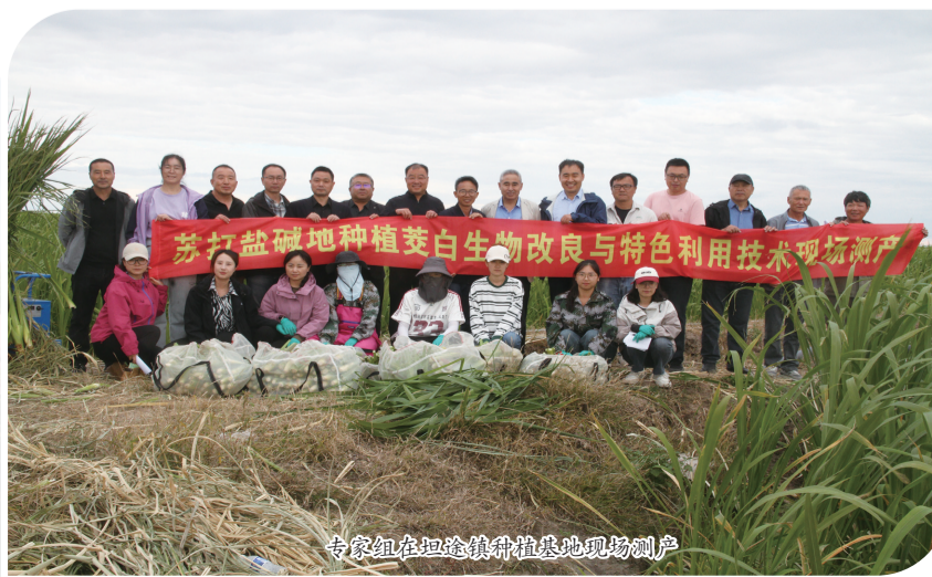
专家组在坦途镇种植基地现场测产