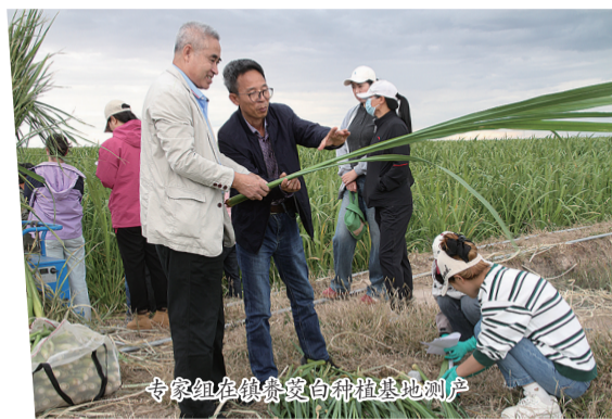
专家组在镇赉茭白种植基地测产