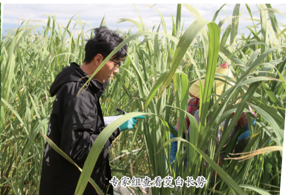
专家组查看茭白长势