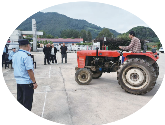
9月4日,临江市组织农机驾驶员考试,为全市农机安全生产工提供安全保障。徐旻 记者郭小宇/摄

舞中拉开帷幕,各支队伍依次上场,节奏感十足的《我把故乡当苏杭》《相遇》,活力四射的《月亮照山城》《欢庆乐舞》等舞蹈,赢得观众阵阵掌声。此次活动不仅丰富了群众的精神文化生活,更搭建了乡镇间文化交流的平台,激发了群众参与文化建设的积极性,让人参文化从产业领域延伸到生活场景,实现“人人知人参、人人爱参乡”的美好图景。