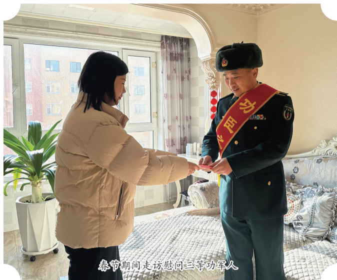
春节期间走访慰问三等功军人