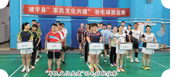
“军民文化共建”羽毛球联谊赛