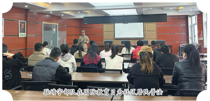
驻靖宇部队在国防教育日进社区居民普法

弘扬抗联精神，沐浴英雄浩气。站在新起点，荣获“全国双拥模范县”的靖宇县，将继续深植红色血脉，持续以“兵事即家事”的赤诚，谱写新时代军民融合发展新篇章，让历久弥新的鱼水深情焕发时代光芒。