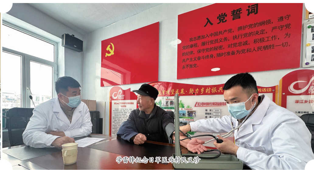
学雷锋纪念日军医进村义诊