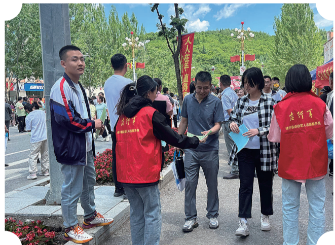
“吉行军”志愿服务队开展高考志愿活动

累计优惠减免15万元。并在城区中心主要商业街道打造“双拥一条街”，拟建设“双拥主题公园”，让军人和退役军人切实感受到尊崇与关爱。