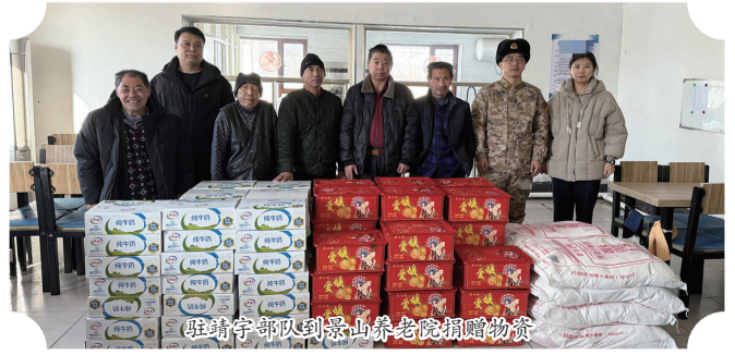
驻靖宇部队到景山养老院捐赠物资