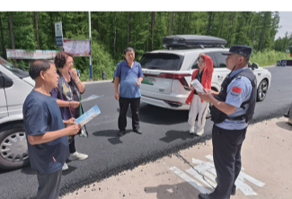
延边边境管理支队双峰边境检查站全力服务G331旅游大通道建设,成为保障游客旅途体验的坚实后盾。