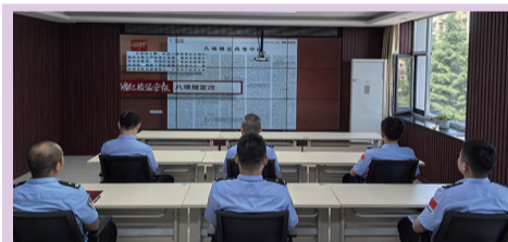
近日,延边边境管理支队二道边境检查站组织观看专题片,提升工作效率。