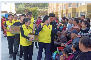
正尚丰商贸将秉持初心,以荣誉为动力,在诚信经营与社会责任道路上稳步前行。

凭借突出表现,公司先后荣获“全国文明单位”“全国三八红旗集体”“全国巾帼建功先进集体”“全国五一巾帼标兵岗”“吉林省模范集体”“吉林省优秀志愿服务组织”等多项称号。正尚丰商贸将秉持初心,以荣誉为动力,在诚信经营与社会责任道路上稳步前行。