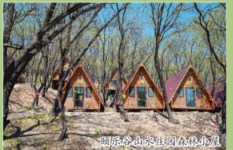
颐乐谷山水庄园森林小屋