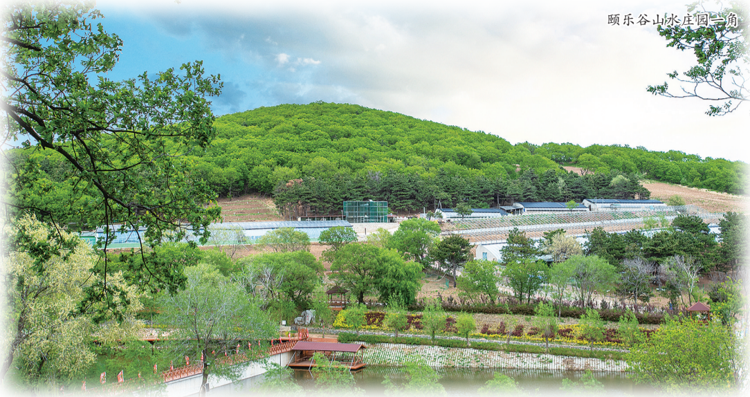
颐乐谷山水庄园一角

嫣红嫩绿斗芳菲,争向东风次第开。经历了数月严冬,伊通县迎来了桃红柳绿、春暖花开的美好季节,行走在伊通,真切地感受到这片土地涌动的生机和活力。