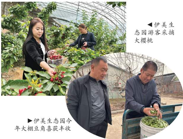
伊美生态园游客采摘大樱桃

伊美生态园以现代农业生态采摘为主体,集集体旅游、休闲度假、绿色果蔬采摘、生态餐厅、休闲娱乐、苗木培育、鲜花种植、科普教育于一体的文旅田园综合体。