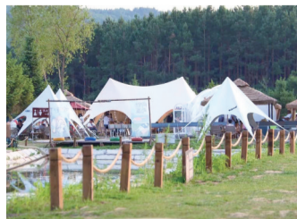
悦野露营地利用山水公园的自然风光,以“露营”为主题。

激活乡村休闲农业“一池春水”,伊通县正在推动“好风景”走向“好经济”,迈向“好生活”。