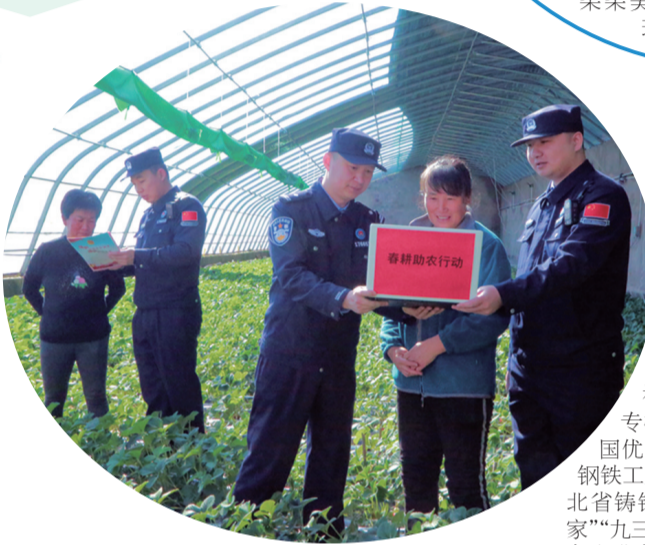
近日,白山边境管理支队漫江边境派出所成立“民警服务小分队”,走进田间地头帮助农户选购春耕物资。

群众宣传中央民族工作会议精神、民族政策法规等,积极营造“民族团结一家亲”的良好氛围,为构建和谐警民关系奠定坚实基础。 (陶莹)