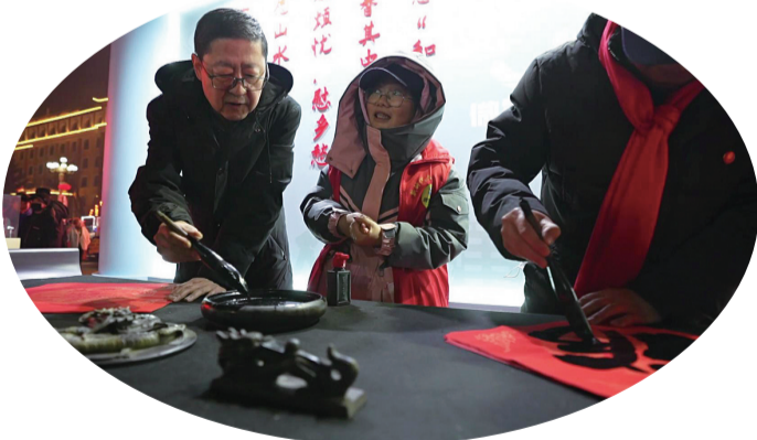
“微笑江源·龙马精神”送福字