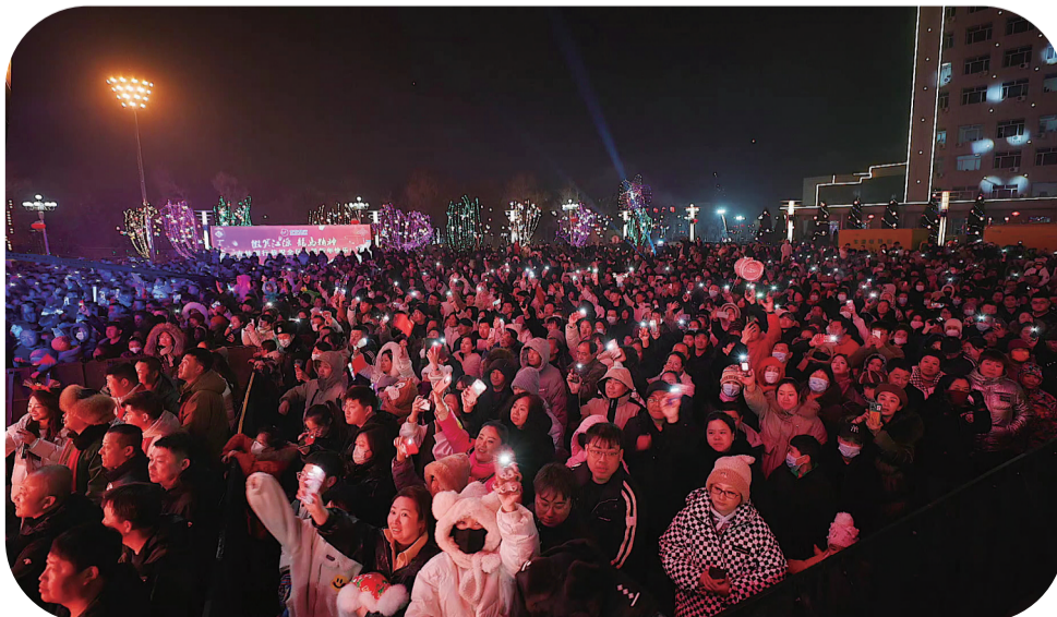
万人歌会现场氛围火爆