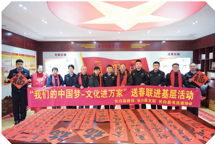
近日,白山边境管理支队长白镇边境派出所邀请长白县政协、长白县文联、长白县书法家协会的书法家,开展送春联进警营活动,为民警送上新春祝福。

金华乡因地制宜、扎实做好农作物田间管理技术培训工作,全力推进全乡粮食生产提质增效,推动农业产业化登台阶,上水平。