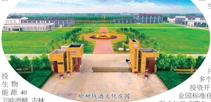
榆树钱酒文化酒庄

乙二醇等方向,把主要精力放在玉米精深加工产业链拉长上,不断凝聚粮食主产区工业经济的后发优势。在先后引进中粮生化能源版块60万吨淀粉、国