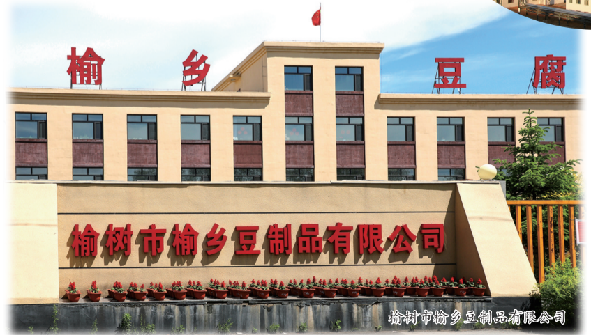
榆树市榆乡豆制品有限公司

2024年,长春榆树经济开发区将抓住新时代推动东北全面振兴的战略机遇,继续坚持生物化工产业发展导向,围绕“一区五园”的总体发展规划,以创新为引领,以大力推进招商引资和项目建设为核心,整合政策、资金、人才等资源,通过招新项目、加快骨干企业改造扩建、盘活存量资产,不断提升经济发展能级和水平,扎实推动开发区高质量发展。