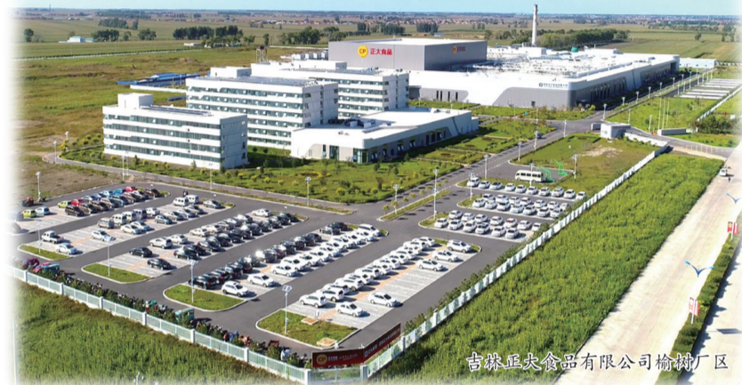
吉林真元食品有限公司榆树厂区

生物化工产业园区:努力发挥玉米主产区资源比较优势,从玉米淀粉、乙醇(酒精)产品做起,沿着淀粉糖、有机酸、丙交酯和乳酸、聚乳酸、