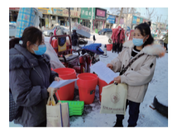
朋友圈转发公益宣传图片。组织工作人员走进辖区乡镇，通过互动解答、发放宣传资料向群众普及相关知识。(杨红霞)

林场工作人员围绕艾滋病的传播途径、防治措施及有关法规详细讲解了艾滋病防治的相关知识。利用微信工作群、