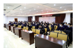
解决办法。要定期通报，及时整改。对于工作中出现的问题，该分行采取每日分享、按周通报、月度总结的方式进行通报，指出当前工作中存在的问题和不足，并及时进行整改，确保各项工作任务高质量完成。

会议要求，要确保精准落实，提高重视程度。自集中授权、集中作业、集中监督上线以来，该分行主管行长深入一线，部署筹谋，制定督导方案，成立督导组，明确人员分工，确保工作落实到位，避免形式主义。要精准分析，提升业务素质。定期召开工作分析会议，对近期工作落实情况进行研讨，找出问题并寻求