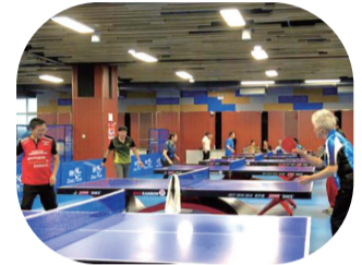
临江市新时代文明实践中心位于全民健身中心，是整合市文旅局、市文化馆等文化阵地资源而建设的综合性场所。

依托功能场室编排推出情景剧、快板等“土味”“趣味”不同形式的理论产品，将党的理论方针政策与老百姓喜闻乐见的方式“连通”起来。