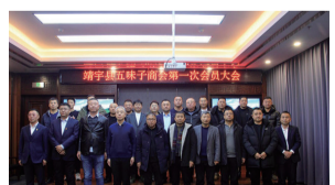
协同发展。商会还将积极推动五味子产业的科技创新、市场拓展和人才培养等方面工作，为产业的可持续发展提供坚实保障。

靖宇农商银行还将为商会提供专业的金融服务和政策支持，帮助商会会员解决融资难题，降低经营成本，提高市场竞争力。同时，银行将与商会共同探索创新金融模式和服务方式，为五味子产业的健康快速发展提供全方位的金融保障。