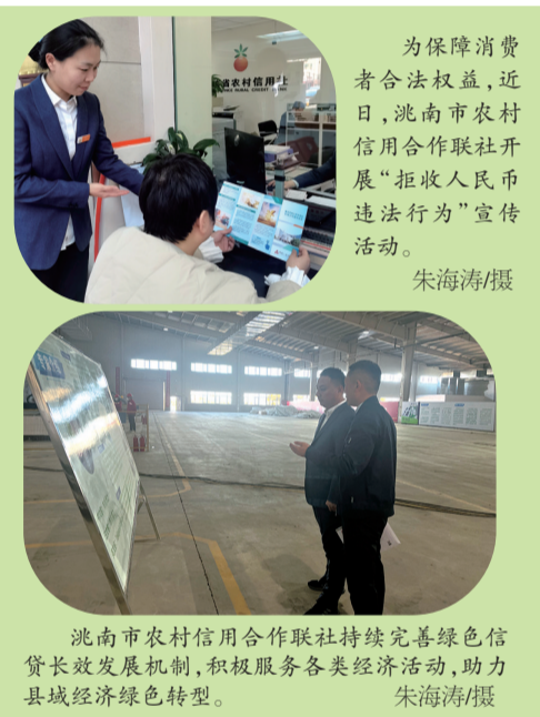
为保障消费者合法权益，近日，洮南市农村信用合作联社开展“拒收人民币违法行为”宣传活动。

亮眼数据的背后，是桦甸市对城市承载力提升、城乡人居环境改善、城市建设不断发展的持续探索和破题。在城市更新这场关系民生幸福的生动实践中，桦甸市坚持以满足群众日益增长的美好生活需要为出发点和落脚点，努力扮靓城市“面子”，做实文明“里子”，托起稳稳的幸福。