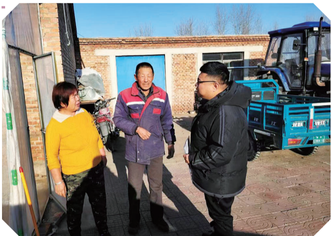
镇贵农商银行坚守服务“三农”的理念,牢记支农支小战略定位,多措并举提高服务质效。通过信息采集、客户评议,全面打通农户线上贷款渠道,实现主动送贷款上门。

取样、除治各项工作,仅2023年就投入资金6.7万元,除治枯死黄松针叶树709株。今年秋季,又进行了松材线虫病疫情专项普查,组织全员参加市森防站内业、外业培训,采取APP现地调查拍照,上传到松材线虫病疫情防控监管平台的方法,高效推动查、防、治等各项重点工作,共完成辖区内5601个小班4.6万亩的普查任务,全程未发现松材线虫病疫情。