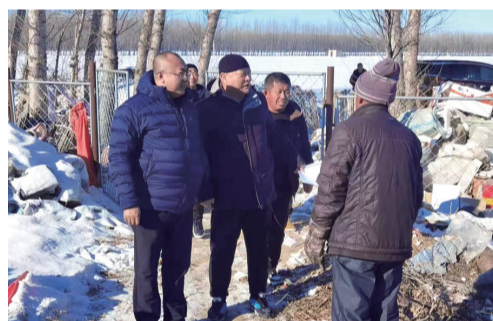
日前,扶余市农村信用合作联社到包保帮扶村永平乡四榆村走访慰问。