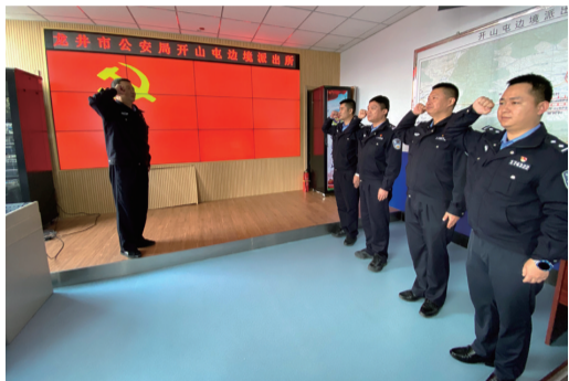
近日,龙井市开山屯边境派出所组织民警重温入党誓词,铸牢忠诚意识。

农行辽源分行将进一步加大对符合绿色低碳发展政策导向企业的信贷资金支持力度,深化银企合作,履行社会责任,体现大行担当,为能源企业发展继续提供金融支持。