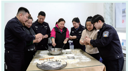
11月6日,白山边境管理支队新市边境派出所民警邀请辖区群众开展“包饺子、迎立冬”活动。