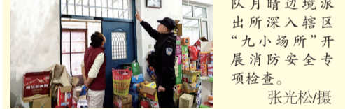
近日,延边边境管理支队月晴边境派出所深入辖区“九小场所”开展消防安全专项检查。