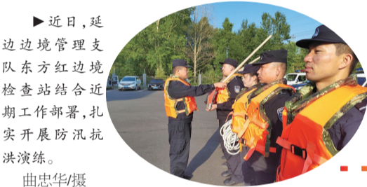
近日,延边边境管理支队东方红边境检查站结合近期工作部署,扎实开展防汛抗洪演练。