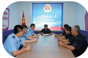
近日,延边边境管理支队凉水边境派出所与庆荣村开展“两个支部一堂课”活动,邀请辖区老党员讲党课。

2023年7月27日21时26分,梅河口市站前路发生一起道路交通事故,造成一名残疾中年男性当场死亡。该男性死者头戴黑色鸭舌帽,上身穿白色半截袖,下身穿灰色裤子,无下肢,身背一黑色单肩包。现无法查明其真实身份,有知情者请与梅河口市公安局交通警察大队事故处理中队联系。 如登报后三十日内仍无人认领尸体的,经县级以上公安机关或者上一级公安机关交通管理部门负责人批准,可以及时处理。 梅河口市公安局交通警察大队事故处理中队 联系人:柳警官 18543677757 张警官 18543677557 0435-4753122