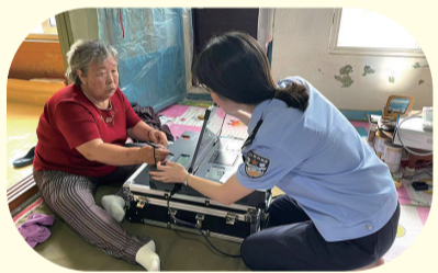
延边边境管理支队图们大队红光边境派出所持续优化便民服务举措,上门为行动不便老人办理各类证件。

怀,从小树立正确职业观。民警还将通过警校联系群、村屯工作群,协助做好学生假期管理监督,为驻地学生打造平安暑假。(朱海涛)