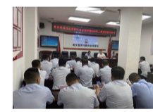
和乡村振兴的重点领域和薄弱环节。积极落实减费让利政策要求,通过降低贷款利率、延期还本付息、无还本续贷等方式助力民营企业持续发展。(王永刚)