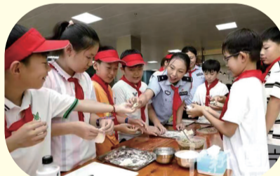
近日,延吉市12所小学的80余名师生来到延边边境管理支队新华边境派出所参观警营,开展暑期研学活动。