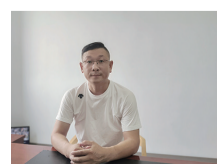
旧会保持24小时待命,半夜被临时的急救任务叫走是常态。

让他成为困难老人的“儿子”。回到原单位后,他带领医护人员提升业务水平,院里大小的事情他都亲力亲为。