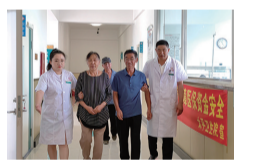
管理,建立管理及工作制度并严格落实。承担对村卫生室的业务指导、考核和乡村医生业务培训。建立分工协作制度,以业务、技术、管理为纽带,与上级医疗机构建立长期稳定的分工协作机制。(孙庆斌 张奕晗)

吉林市船营区搜登站镇太平卫生院为群众提供基本医疗服务、公共卫生服务、健康管理服务,承担船营区卫生健康局委托的卫生管理职能。