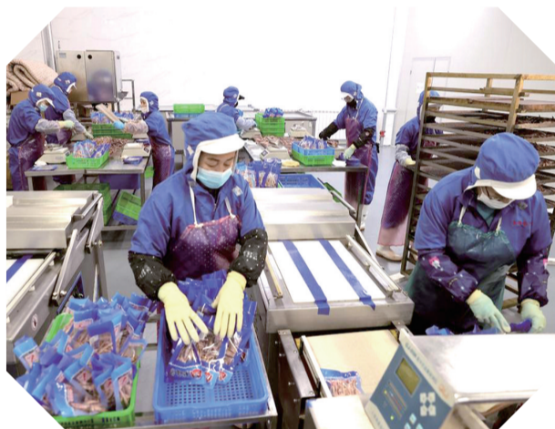
近年来,琿春市依托区位优势,持续深化对俄经贸合作,进口加工业、能源、鲜活海产品等产业集群已逐步形成。图为当地一家海产品加工企业的生产车间。

提高。对企业提出的农民工劳动合同如何签订、农民工工资专用账户如何开设等问题,采取“面对面”解答方式,指导企业发挥集体协商作用,稳定工作岗位,引导企业与职工共渡难关,促进构建和谐劳动关系。同时,针对企业招工问题,区就业局及时发布招聘信息,区政务服务中心大厅电子大屏幕滚动播放招聘信息。线下开展“春风行动暨就业援助月”活动,开展“送信息、送政策、送权益、送温暖、送服务、送岗位”服务,帮助企业搭建供需对接平台,促进人岗精准对接,帮助解决企业招工难问题。目前,企业提出招工需求97个岗位,已帮助解决24个。