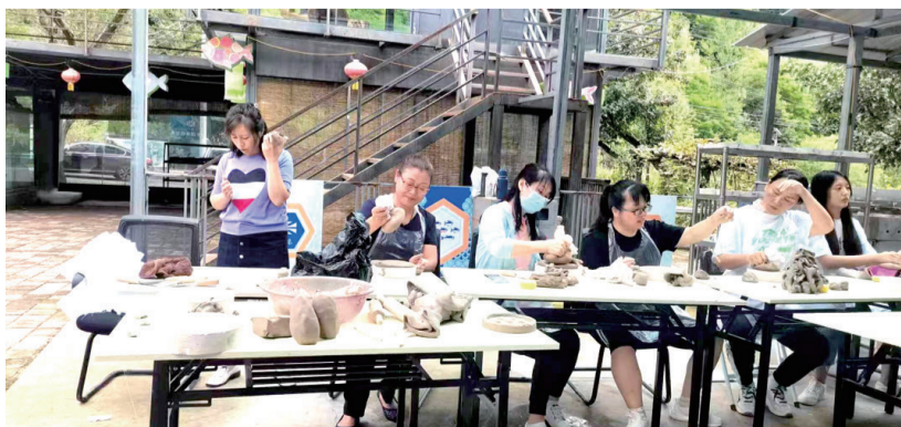
集安市在下活龙村举办中小学教师“非遗进校园”技能培训班

依山傍水，风光秀丽，江中鱼群密集，是鸭绿江渔猎的首选地。这里，就是集安市麻线乡下活龙村。在乡村振兴的进程中，这个江畔渔村创建“乡里农创园”，联合高校建立“双创”平台，打造出“绿水青山就是金山银山”的“下活龙样板”。