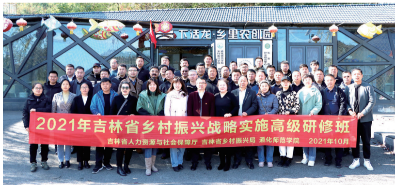
下活龙村“乡里农创园”已成为乡村振兴的研修基地