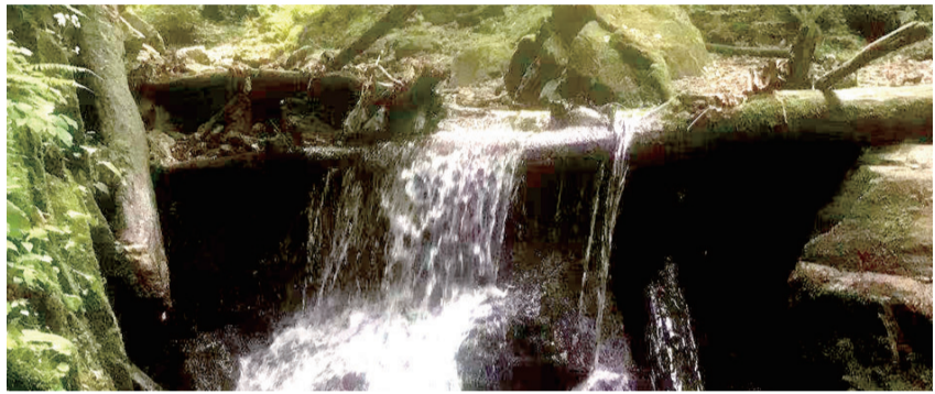
秋皮村生态条件得天独厚

如今，林蛙已成为秋皮村致富产业的翘楚，年产值超过140万元。对于这个小山村而言，非常可观。面对良好的发展势头，秋皮村进一步拓展林蛙产业效益链条。依托山水秀丽的生长环境，在发展休闲观光农业上做文章；借助林蛙鲜美的味道和当地丰富的鱼类资源优势，在特色餐饮方面下功夫；结合林蛙滋补功效和当地广泛种植的中小药材，发展健康产业，让绿色财富造福更多村民。