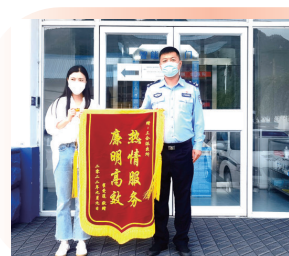
日前,龙井市三合边境派出所民警帮助群众找回丢失的手机,群众赠送锦旗表示感谢。

此次活动,让师生近距离接触消防、体验消防、学习消防,切实提高了学校的消防安全管理水平。