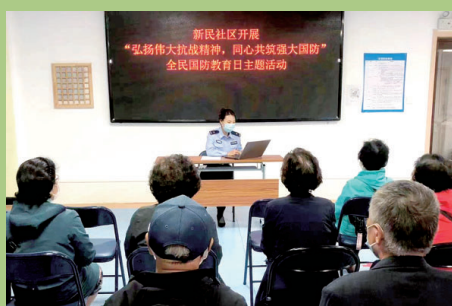
近日,延边边境管理支队新华边境派出所走进新民社区,组织开展了“全民国防教育日”宣传活动,切实提升群众法律意识。