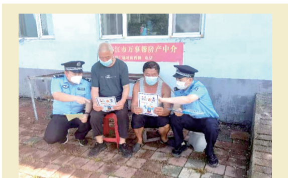
近日,白山边境管理支队六道沟边境派出所开展普法宣传教育活动,民警采取发放宣传资料、现场讲解、接受群众咨询等方式开展普法宣传。

政策加力。明确工作目标、细化工作措施,确保有计划、有步骤地助企纾困。创新加持。围绕个体工商户、小微企业主以信用、保证、抵押等方式,推出多种信贷产品,用于满足辖内个人生产经营需求,有效解决小微企业融资难题。降低成本。组织开展降低小微企业和个体工商户支付手续费的工作,降低小微企业和个体工商户转账汇款手续费、账户服务费、电子银行服务等支付领域手续费。(范雪亮)