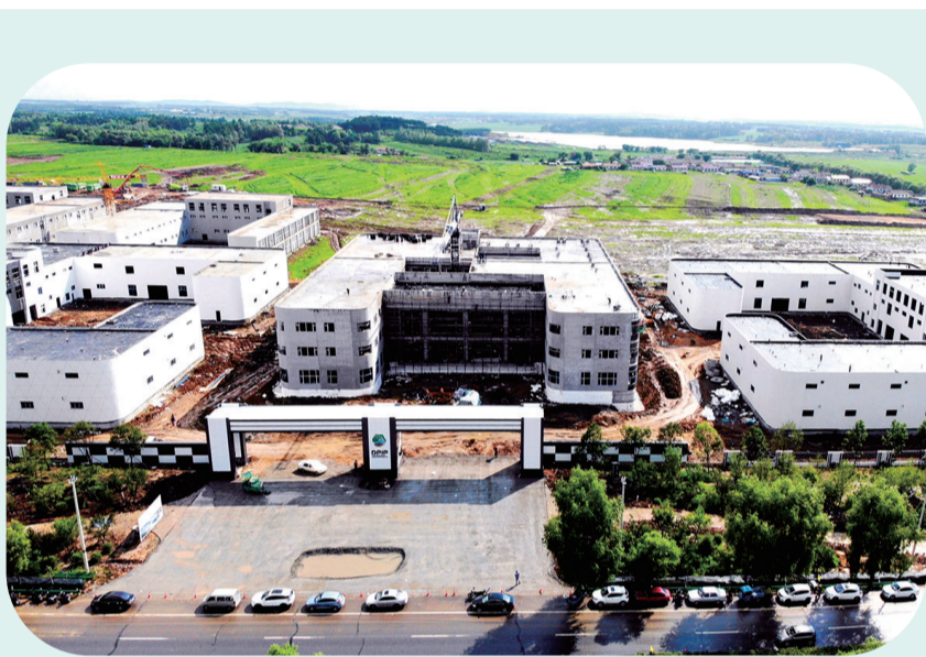
中国·东丰松籽产业园建设现场

远处,群山逶迤,终年秀丽;近处,满山果园,硕果累累。百年古树、百岁古井触景生情的“美丽乡村”如约而至……现如今,榆林村“食有鲜果、住有朴宿、游有美景、闻有故事”的“世外桃源”新画卷正在徐徐展开。