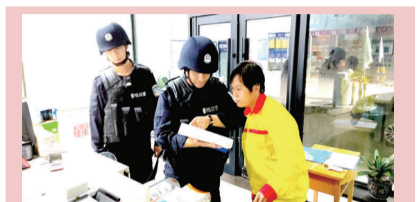
近日,龙井市开山屯边境派出所大力开展辖区安全检查工作,对辖区所有行业场所进行安全隐患摸排,及时解决各类苗头性问题。