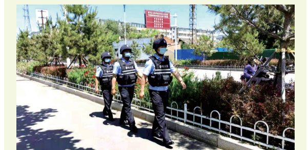
近日,延边边境管理支队新华边境派出所针对节日期间旅游人员增多的实际,组织民警对图们江广场开展巡逻工作,确保游客及辖区安全稳定。

据了解,摄影采风活动一直是该行企业文化中的璀璨明珠,员工参与度高、反响热烈,互动体验式学习不仅愉悦员工身心,也为员工提供了一次掌握实用技能的机会,为提高该行队伍凝聚力、落地深植特色企业文化起到积极的促进作用。(于雪)