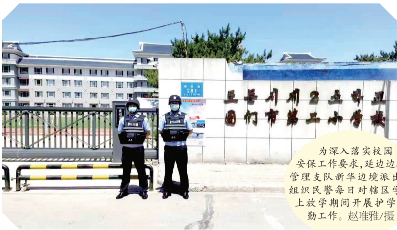
为深入贯彻落实校园安保工作要求,延边边境管理支队新华边境派出所组织民警每日对辖区学校上放学期间开展护学执勤工作。

科技领航新时代。铁东区正合力拉开新时代数字农业农村发展“大幕”,为乡村振兴注入强劲新动能,为广大农民带来更多福祉。