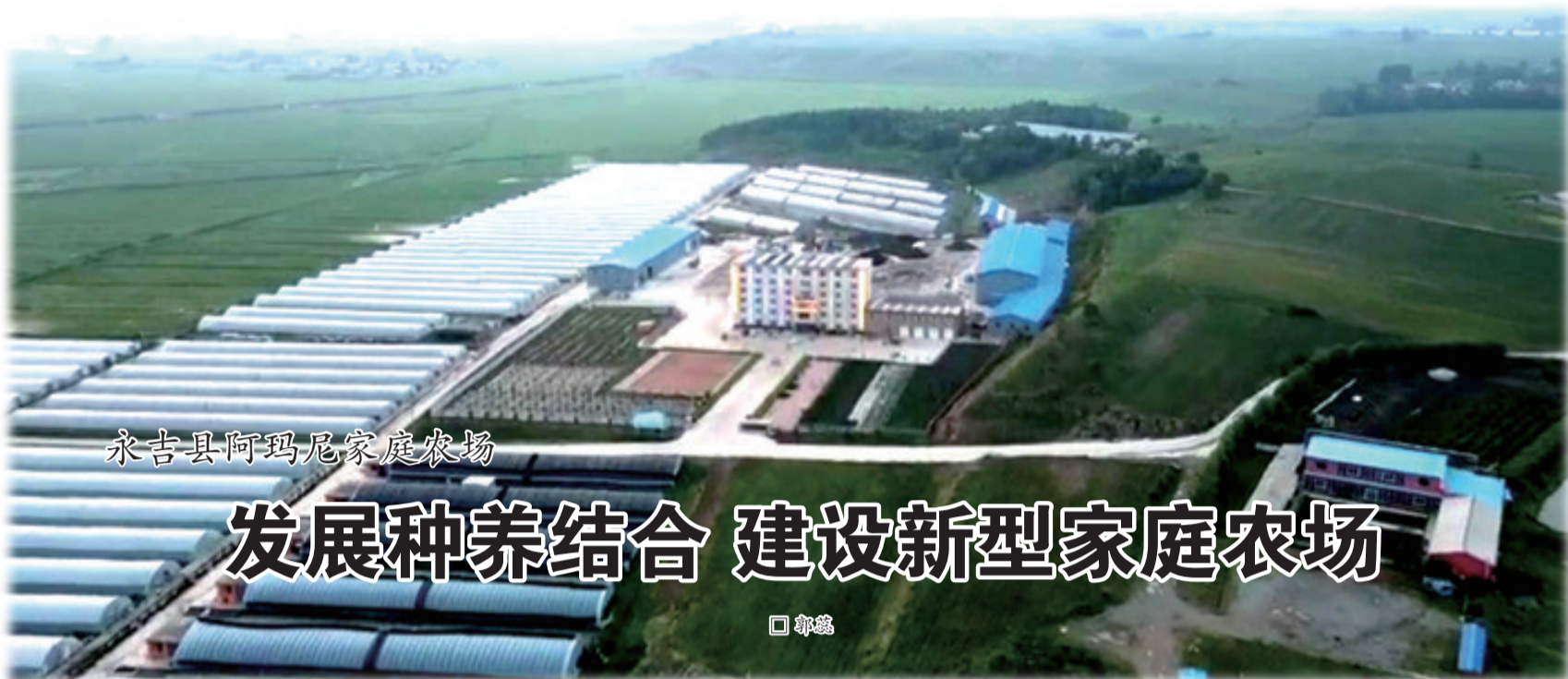
永吉县阿玛尼家庭农场