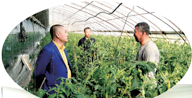
七道江镇无公害蔬菜基地大棚

加强统筹协作,助推在建项目。为改善浑江区旅游景区、节点旅游厕所建设薄弱环节,2020年向省文旅厅争取了80万元旅游厕所建设补助资金。依托《吉林省文化和旅游厅关于有效应对疫情,支持文旅企业发展的13条政策措施》,为浑江区高丽沟农业观光园申报了3万元的水电暖补助资金;今年以来,浑江区高丽沟农业观光园已完成投资20万元,花海观光已接待游客达两万余人次。积极与杭州白e国际成立仁弘生物科技有限公司,并研发黑人参产品系列项目,现产品生产线、包装等基本完成。鸭绿江·冰葡萄产业园项目落地,白山项目建设运营公司已经成立,正在办理项目前期手续,公司设计人员对酒的生产车间、工艺、展示、体验等已在设计中。这些旅游项目的推进将对浑江区发展从点到面、全域旅游提供积极引领作用。