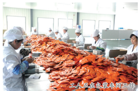
工人正在包装车间工作

落实任务,抢抓机遇。积极围绕“十个围绕”、新基建“761”工程,制定“五个推进”发展战略工作方案,即推进重大创新载体建设、推进重大产业项目建设、推进重大生态环保建设、推进重大民生工程建设、推进重大基础设施建设。坚持新型基础设施投资与传统基础设施投资、政府投资与民间投资并举,着力强化“补短、成网、联动、配套、共享”,进一步提升基础设施供给质量和运行效率,推动“十四五”期间浑江区基础设施加快补齐短板。截至6月份,浑江区谋划“十个围绕”和新基建761项目53个,包括白山市泰安湖满族风情园、白山市七道江村狼洞沟、白山市高丽沟农业观光园、白山市三道沟边境口岸旅游区、白山市城市会客厅建设项目——国家级少数民族特色村寨、白山市浑江区鲜明朝鲜族特色村寨等项目,持续增强全区发展内生动力。