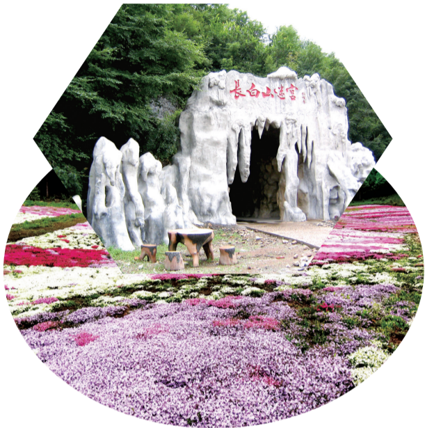
农业休闲项目“长白山迷宫”

从白山市区出发,驱车10多分钟就能到达河口街道河口村花海。沿着铺设好的柏油村路,一路伴着密林流水,花溪潺潺,赏心悦目豁然开朗,漫山遍野的芝樱花洒落在山峦间,使游客流连忘返。