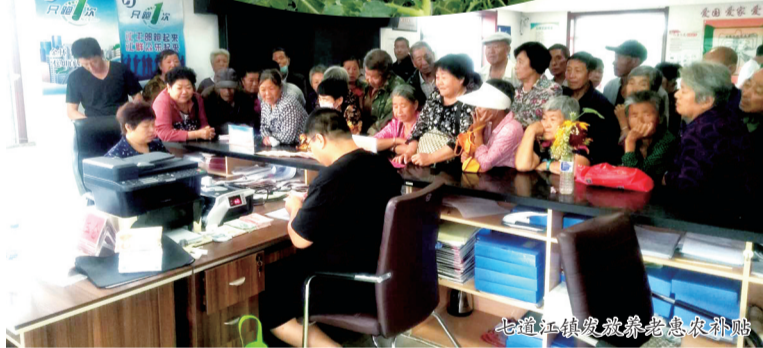
七道江镇发放养老惠农补贴