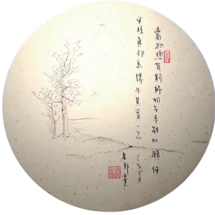
当初总有期许,如今未能如愿。何必枉负初衷,得失其实一念。