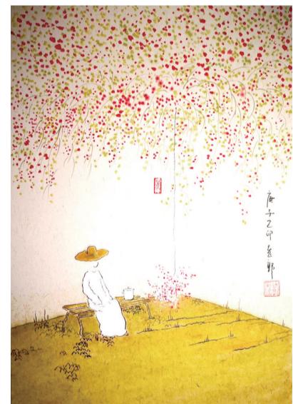
满园春色可鉴,花期却不识名。开了也就开了,有谁会动真情?