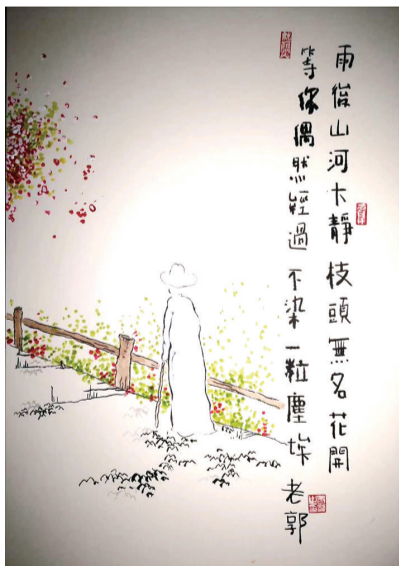
雨后山河大静,枝头无名花开。等你偶然经过,不染一粒尘埃。