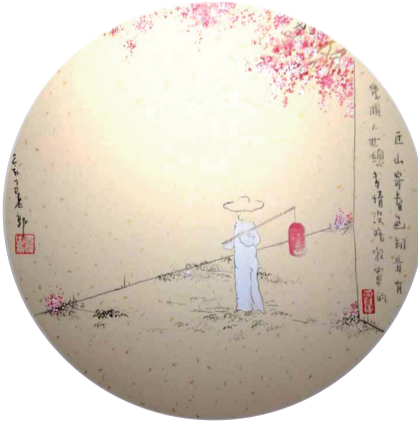
丘山寄春色,知音有几个?人世总多情,没啥寂寞的。