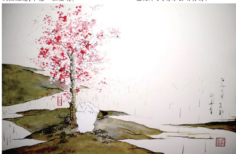
人在孤独寂寞,总念花落花开。其实都是过客,就像一粒尘埃。