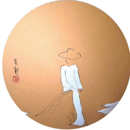
冬至大雪,驱车入山。平湖在野,有鱼于川。网而捕之,梭行冰下。煨而炖煮,是为壮观。朋友啸聚,把酒来欢。冗冗俗务,明年再谈。