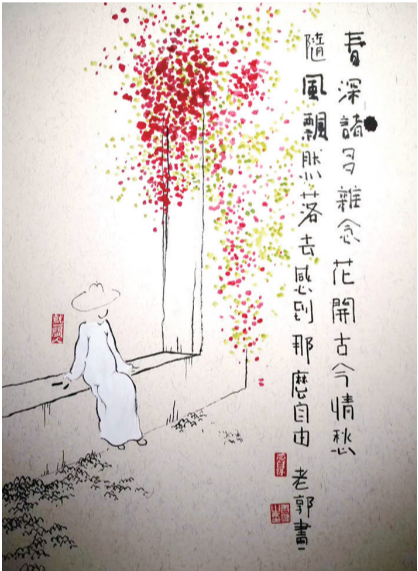
春深诸多杂念,花开古今情愁。随风飘然落去,感到那么自由。