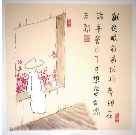
谁从眼前过,谁折梦里花。诸事管不了,只想斋在家。