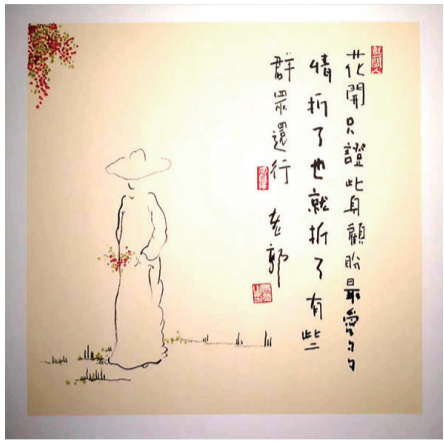
花开只证此身,顾盼最爱多情。折了也就折了,有些群众还行。