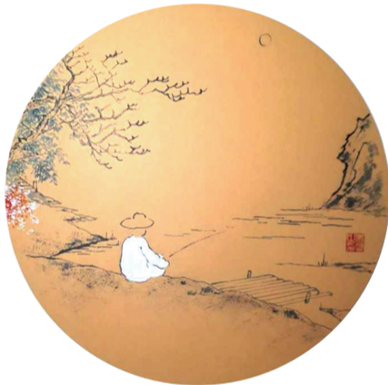
山高路漫,水深流长。适时花下,在你身旁。闲居陋所,出入厨房。种点蔬菜,薄存余粮。澄明简净,不去瞎忙。