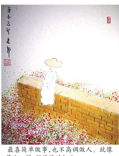
最喜简单做事,也不高调做人。就像花儿一样,偶然路过红尘。