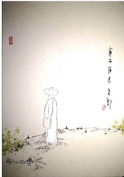
春风吹起,大雁北回。天大地大,你又为谁?