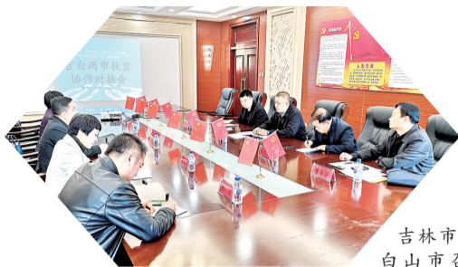
吉林市、白山市召开扶贫协作对接会

推动扶贫协作,全力攻克坚中之坚,齐心协力打好脱贫攻坚战。同时,进一步拓展交流合作领域,共同推动更宽领域、更多层面的务实有效合作,以各方面工作的新进展和新成效,实现优势互补、良性互动,打造区域合作新典范,开创携手发展、共同富裕的美好明天。