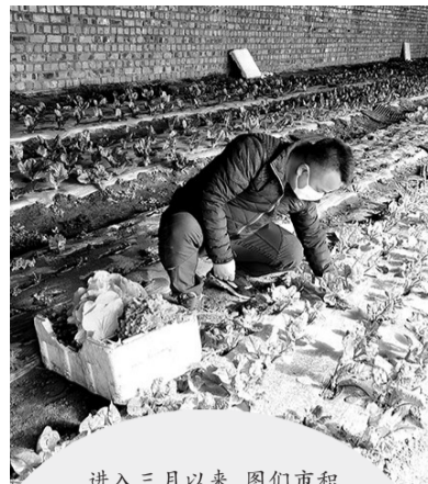
进入三月以来,图们市积极引导蔬菜种植专业合作社和菜种植大户,在抓好疫情防控的同时,不误农时,努力发展春季蔬菜生产,保障市场蔬菜供应,增加农民收入。图为石砚镇水南村农民在大棚里采收叶菜。

确、高效协同的指挥体系。全省规划200多个火灾多发易发危险区,确定400多支跨区增援队伍,各支队伍明确支援任务、增援路线、赶赴时间和装备给养配备要求,确保遇有紧急情况,能够快速形成区域联动,快速集结支援力量,奔赴火场实施重兵扑救。