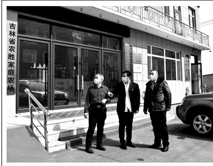
吉林省农胜家庭农场

拉拉河镇结合实际,立足于“早”字,做到生产计划早安排,技术推广早部署,增产措施早落实,技术服务早行动,确保春耕开好局起好步。截至目前,该镇农民已经订购良种6400公斤,农药1300公斤,农膜3吨,化肥1200吨,镇农业站科技人员利用手机微信短信发送备耕信息100多条。(李及肃 孙鹤 王玉君)